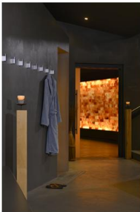
Ancora uno spazio all'interno della spa del Lido Palace di Riva del Garda (TN).