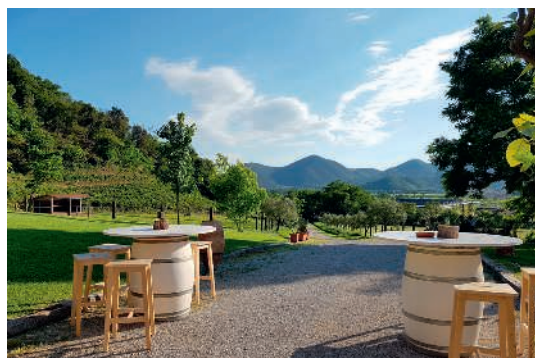
25 ettari di verde al Casale al Colle.

Primo esempio di mecenatismo ambientale, l' Oasi Zegna è un'area naturalistica in provincia di Biella, creata e promossa da Ermenegildo Zegna. Un luogo idilliaco per i piccoli, che qui riconoscono le erbe spontanee del bosco, scoprono i filati dalla natura e si divertono in una caccia al tesoro botanico, come quella organizzata dai Grandi giardini italiani il 17