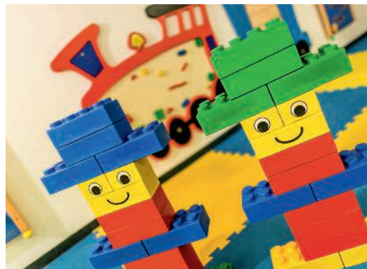
Alto Adige: kids friendly per tradizione.