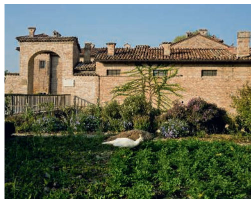
L'Antica Corte Pallavicina vicino a Parma.

PREZZI: doppia due adulti e due bambini da 220 euro a notte, con pensione completa.