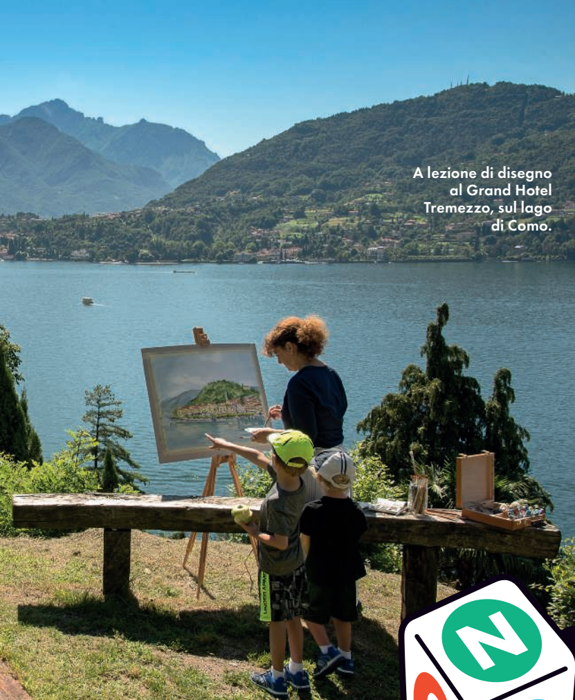
A lezione di disegno al Grand Hotel Tremezzo, sul lago di Como.