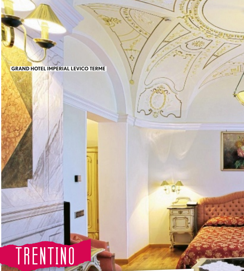
GRAND HOTEL IMPERIAL LEVICO TERME