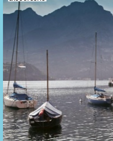
LAGO DI COMO

• Il pacchetto di San Valentino (€ 220) comprende, oltre al pernottamento in suite, cena a lume di candela, colazione in camera e late check-out. Corazziere.it