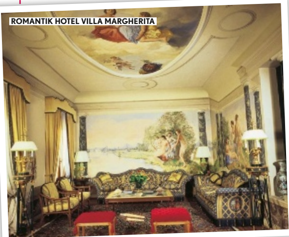
ROMANTIK HOTEL VILLA MARGHERITA